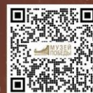
Иосиф Виссарионович Сталин Москва Музей Победы

24 июня 1945 года на Красной площади Москвы состоялся Парад Победы. Это был триумф народа-победителя, который показал всему миру, как одержать победу, не взирая на боль, лишения и страх. Решение о проведении парада в честь победы над нацистской Германией было принято Верховным Главнокомандующим Иосифом Виссарионовичем Сталиным после Дня Победы — 15 мая 1945 года.