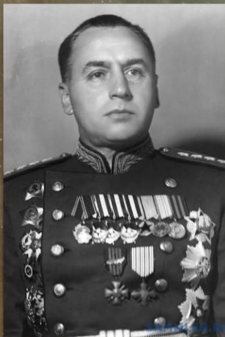
Алексей Иннокентьевич Антонов Начальник Генерального штаба РККА (февраль 1945 — март 1946) Музей Победы