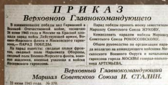
Приказ Верховного Главнокомандующего Маршала Советского Союза И. Сталина от «22.06.1945» № 370

24 мая И.В. Сталину были доложены предложения Генерального штаба по проведению Парада Победы. Их он принял, но не согласился со сроками проведения. В то время как Генштаб отводил на подготовку два месяца, Сталин приказал провести парад через месяц. В тот же день командующим войсками Ленинградского, 1-го и 2-го Белорусских, 1-го, 2-го, 3-го и 4-го Украинских фронтов была направлена директива за подписью начальника Генерального штаба генерала армии А.И. Антонова: