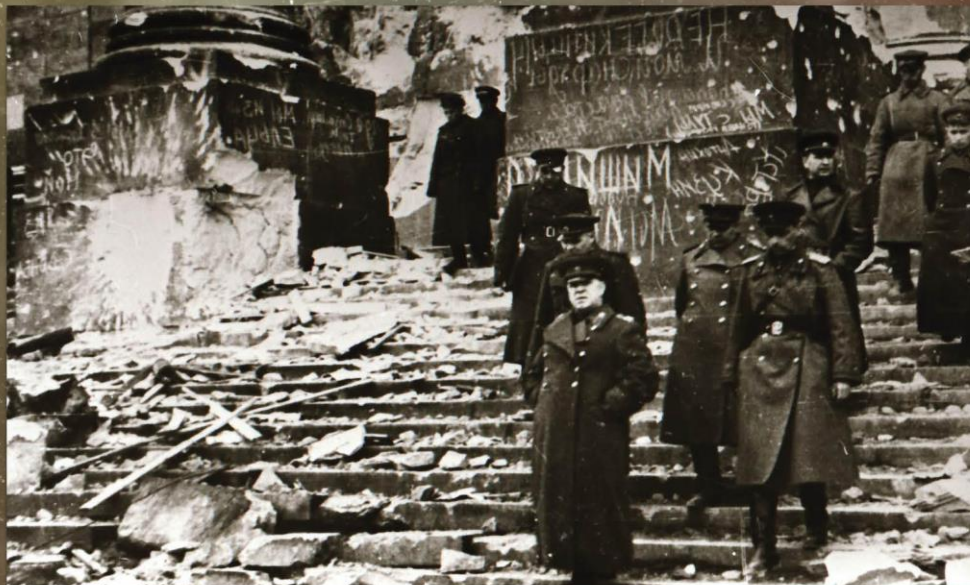
Г.К. Жуков осматривает рейхстаг в Берлине с группой офицеров Германия, Берлин, 3 мая 1945