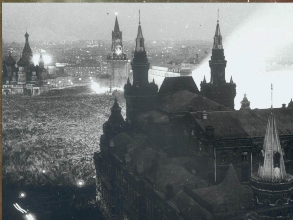
Красная площадь, заполненная людьми в праздник Победы над Германией Москва. Июнь 1945

Уинстон Черчилль премьер-министр Великобритании