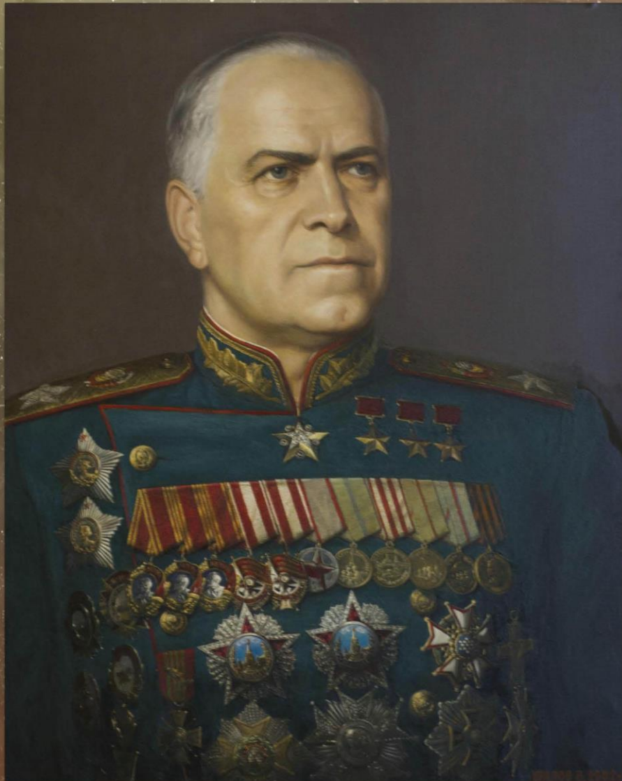
Портрет Маршала Советского Союза Г.К. Жукова В.Э. Шилов Россия. 2002 Музей Победы