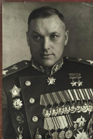
Константин Константинович Рокоссовский Дважды Герой Советского Союза, Маршал Советского Союза, командующий Парадом Победы, кавалер ордена Победы (в полном парадном обмундировании со всеми наградами) СССР, Москва, Июнь 1945

Из книги Ариадны Рокоссовской «Утро после победы»